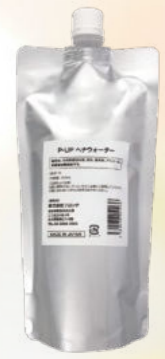
P-UP ヘナウォーター 内容量:500mL 3,000円(税抜) ※必ずP-UP ヘナウォーターを ご使用ください

P-UP ヘナ AAA 内容量:100g 各3,600円(税抜) 天然成分100%