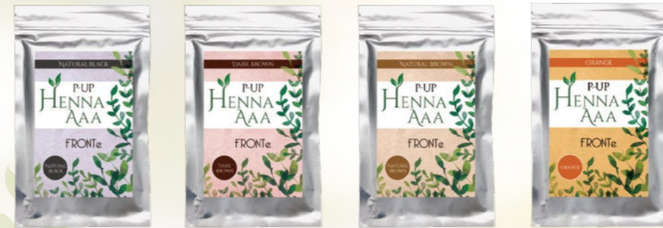
ナチュラルブラック ダークブラウン ナチュラルブラウン オレンジ